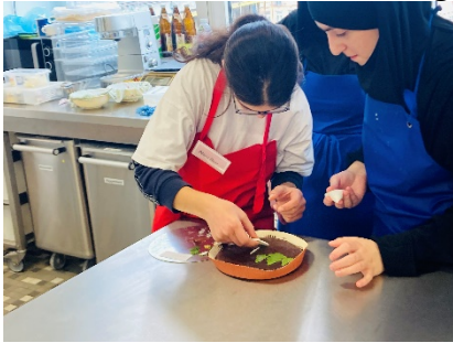
Wir haben in Zweiertteams gearbeitet.