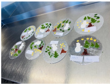
Wir haben den Kuchen dekoriert.