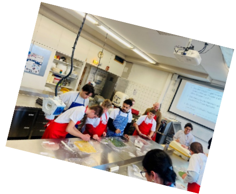
Es hat uns sehr Spaß gemacht.